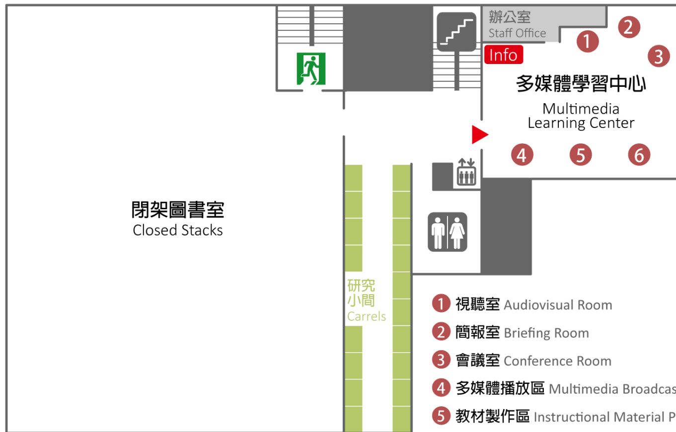
4F 臺大醫圖四樓平面圖 NTU Medical Library